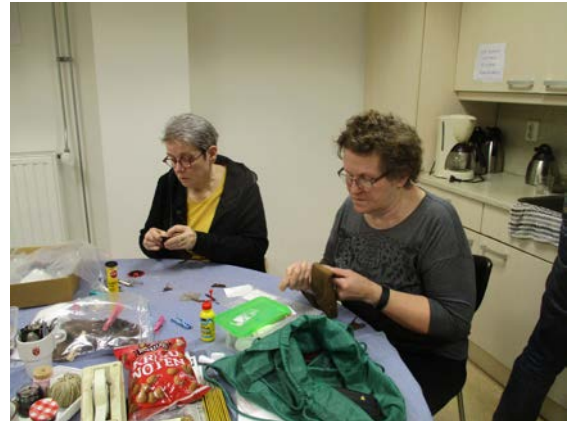
Metaal en leer bewerken in het depot in Bergen op Zoom.