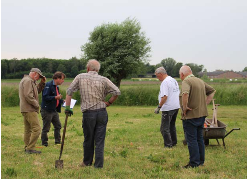
Overleg voor het maken van een sleufje om de gegevens te controleren in het begin van 2020

In de loop van het jaar werden de plannen samen met alle betrokkenen uitgewerkt. De Smalle Beek krijgt een 'uitstulping naar het oosten' zodat op die manier de vijfhoek van het vroegere terrein weer zichtbaar wordt. Het toegangspad aan de oostzijde krijgt een slinger, zodat dit precies tegenover de oostpoort uitkomt. Aan deze zijde komt een brug die alleen voor voetgangers te gebruiken is.