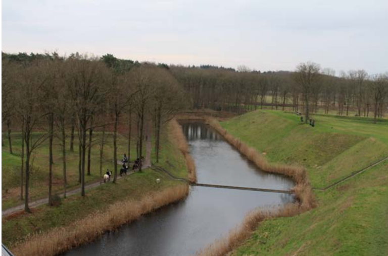
Een bezoek aan Fort de Roovere om een indruk te krijgen van onze toekomstige grachten.

op te doen voor de herinrichting van ons terrein. We kregen in elk geval een idee van de hoeveelheid grond, die verplaatst moet worden en de hoogte van de toekomstige wallen.