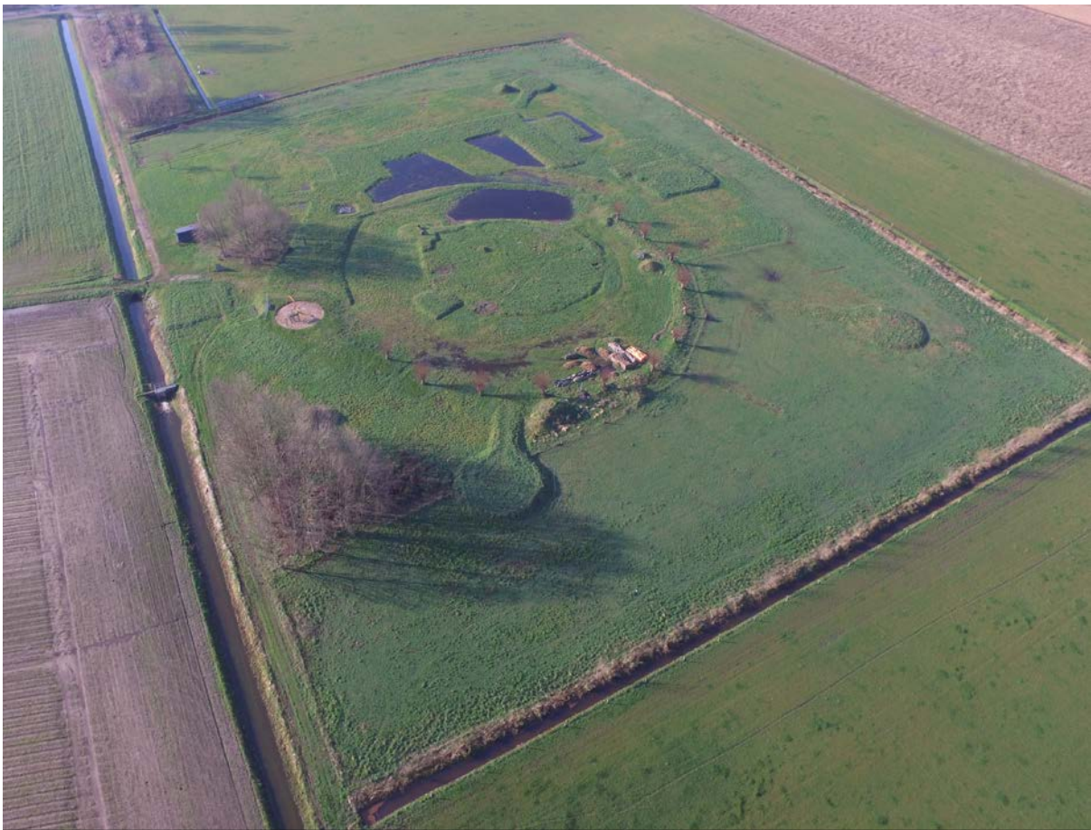
Het Kasteelterrein op 7 maart 2020