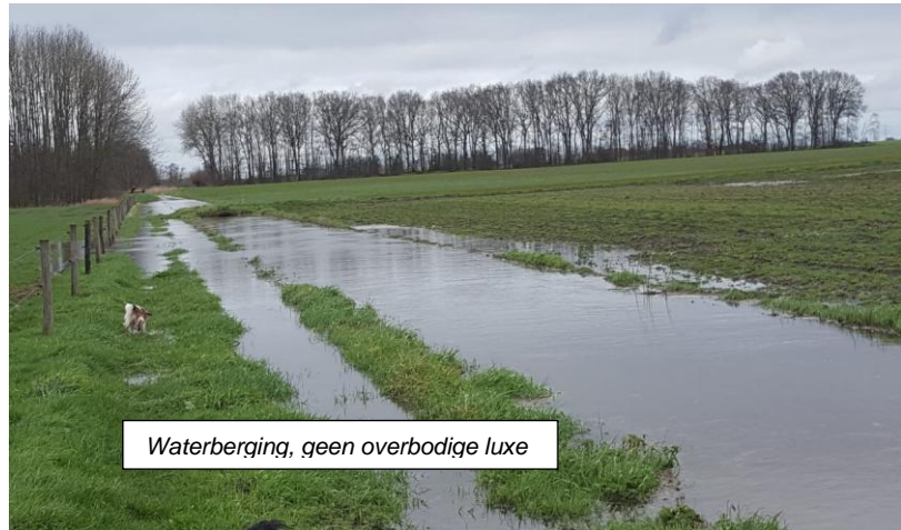
Waterberging, geen overbodige luxe

Het plan van de aanleg van de kasteelgracht is uitgebreid met de aanleg van een ecologische verbindingszone. Ruwweg loopt deze zone van zuid naar noord. Startend bij de Waterstraat via een aantal bestaande poelen, langs het kasteel,