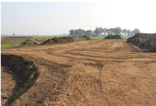
De wal vanaf de noordwestelijke toren. De wal is zestien meter breed en wordt vier meter hoog.

de muur en de steunberen weer in de oorspronkelijke staat terug te krijgen. Daarna werd er gemetseld en gevoegd. Tot zover het goede nieuws.