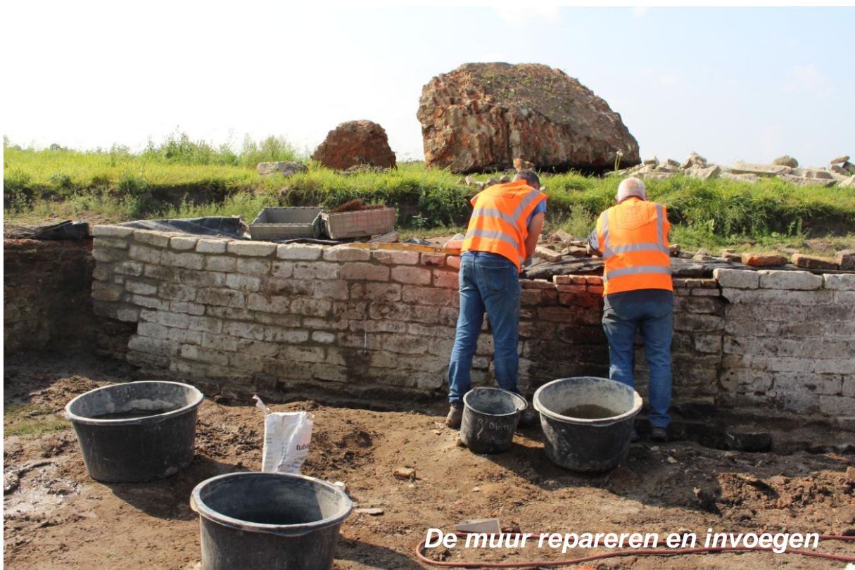
De muur repareren en invoegen