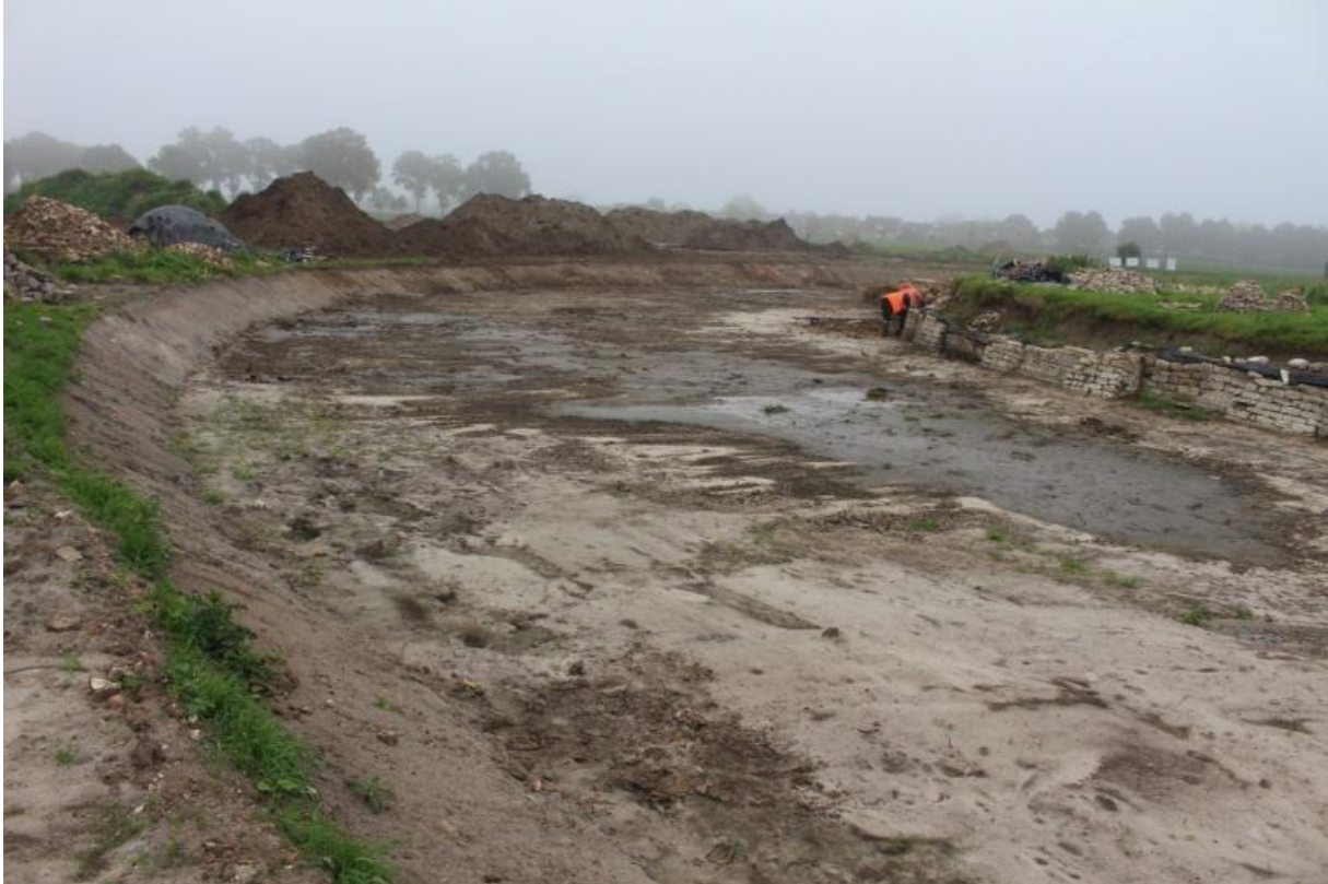
De binnengracht aan de noordzijde van de oude burcht

De afgelopen twee weken zijn de werkzaamheden verder doorgegaan. Ondanks de vakantie werd er op woensdag en zaterdag met een kleine kraan gewerkt. Er werd een huis blootgelegd dat gesitueerd was tussen de voorpoort en de binnengracht. Alles is gepoetst en ingemeten. Later is het met doek en zand afgedekt. Zo blijft het bewaard voor de toekomst.