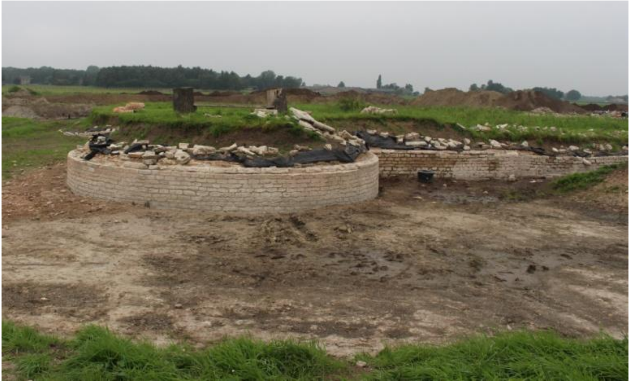
Een deel van het voegwerk van de oude burcht is inmiddels gereed

vrijwilligers de beschadigde en ontbrekende stenen zo dat ze weer ingemetseld en gevoegd kunnen worden. De tijd begint te dringen. We moeten voor de winter invalt wel klaar zijn met het metsel- en voegwerk.